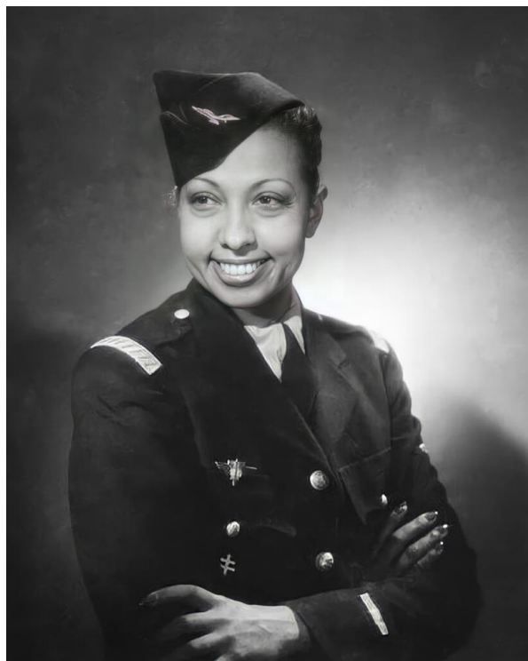
Le sous-lieutenant Baker