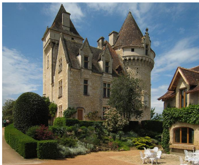
Le château des Milandes

Ne pouvant avoir d'enfants, Joséphine décide d'adopter des bambins de nationalités et de religions différentes. Pour abriter et élever ses douze marmots qui constituent sa « tribu arc-en-ciel », elle achète le château des Milandes et une partie du village de Castelnau-la-Chapelle en Dordogne.