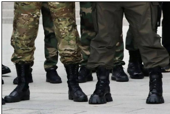
A droite, les boots Prada de Ramzan Kadyrov

Internet s'est également imposé comme une plate-forme pédagogique dans la lutte contre l'occupant grâce à l'utilisation massive « d'influenceurs ». Ces personnes expertes dans l'art de la communication pour générer l'adhésion d'un auditoire donnent ainsi de précieux avis aux Ukrainiens sur les réseaux sociaux pour résister à l'envahisseur. Les séances d'instruction patriotique qu'ils prodiguent concernent notamment la fabrication d'un cocktail Molotov, des conseils pour récupérer des pièces détachées sur des véhicules russes détruits, la confection et la mise en place de pièges antichars, des leçons de secourisme, des recommandations pour protéger les habitations et se méfier des pièges mortels déposés par l'ennemi aux endroits de passage les plus fréquentés, des indices pour repérer les espions, etc. Les messages passent d'autant mieux que le ton employé est celui de l'humour, celui du mépris et de la plaisanterie raffinée, mais percutante.