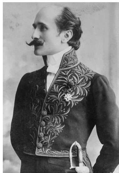
Edmond Rostand, commandeur de la Légion d'Honneur, en costume d'académicien

Dans des conditions de crises, les responsables politiques, les chefs militaires et les meneurs d'hommes sont parfois conduits à manier l'humour pour exalter une population, une armée ou un groupe en désarroi. Pour être efficaces, ils doivent posséder une certaine dose de panache, cette pudeur de l'héroïsme qui permet de susciter l'adhésion. Humour et panache sont deux attitudes qui vont de pair. C'est donc sur cette notion de panache, indispensable support de l'humour, que nous laisserons la conclusion à Edmond Rostand. L'auteur de Cyrano de Bergerac déclarait à l'occasion de sa réception à l'Académie française (4 juin 1903) : « Le panache, c'est l'esprit de bravoure. Oui, c'est le courage dominant à ce point la situation. »